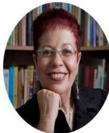
Mrs Nava Semel